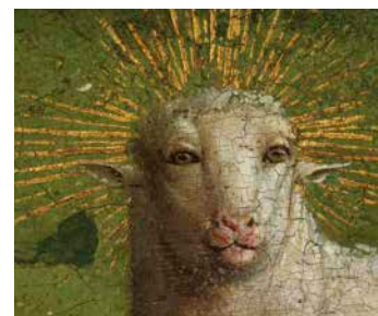
après la restauration