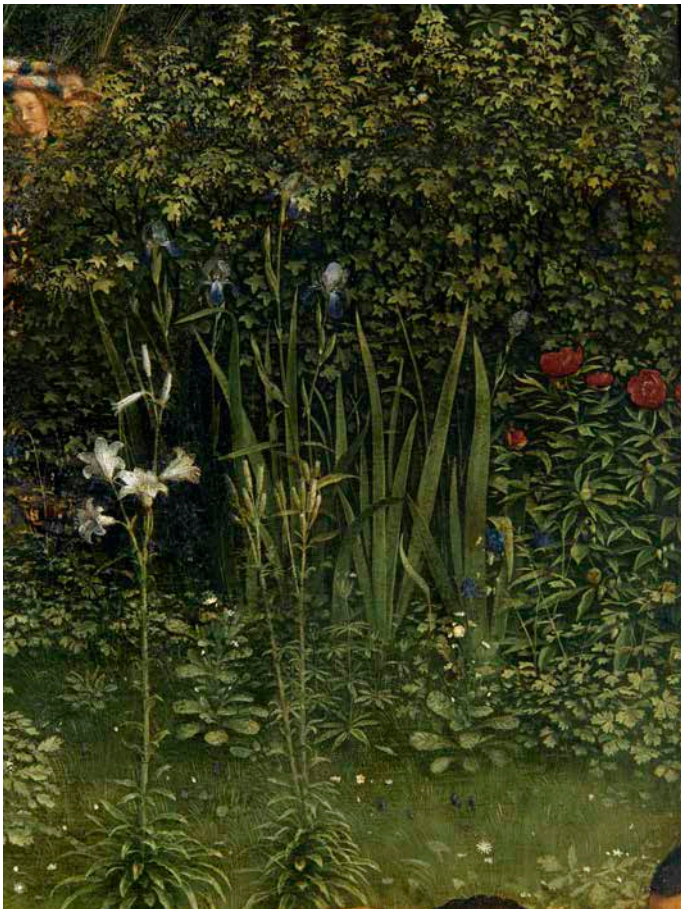
Hubert et Jan van Eyck, l'Adoration de l'Agneau mystique (détail)