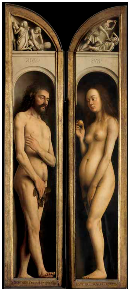
Hubert et Jan van Eyck, Adam et Ève. Volets intérieurs de l'Adoration de l'Agneau mystique , 1432, cathédrale Saint-Bavon Gand.