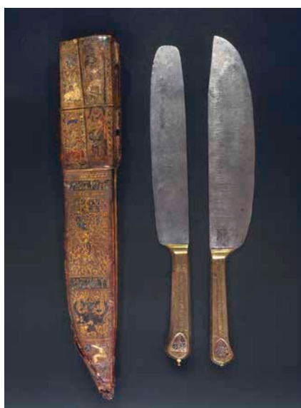
Deux couteaux de Philippe le Bon, vers 1450. Dijon, Musée des Beaux-Arts.

Idée pour à la maison : Invente-toi une devise et fabrique ton propre blason en carton.