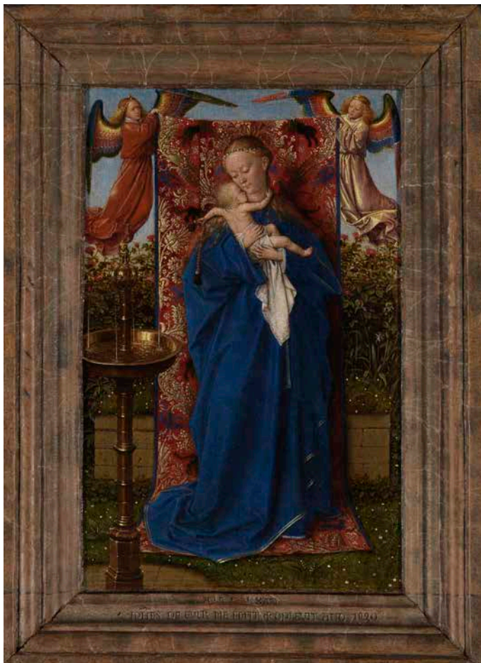
Jan van Eyck, La Vierge à la fontaine , 1439, Koninklijk Museum voor Schone Kunsten, Anvers

Fais une belle photo avec l'aide de ta maman (ou de ton papa). Utilise des draps et des couvertures pour t'envelopper, comme Marie dans sa robe. Ensuite, tu pourras peut-être faire un dessin à partir de la photo, du mieux que tu peux !