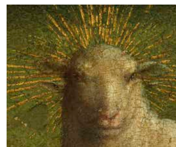
avant la restauration