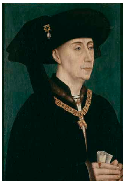
D'après Rogier van der Weyden, Portrait de Philippe le Bon , seconde moitié du xv e siècle. Bruges, Groeningemuseum.

Ici tu peux voir le couteau de Philippe le Bon! Il est orné de sa devise et de son blason, avec sur celui-ci un lion, qui est le symbole de sa bravoure.