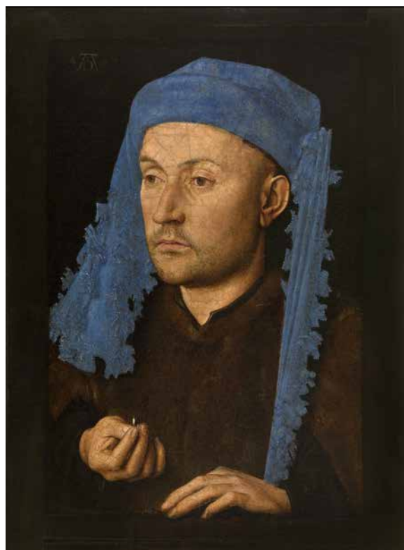
Jan van Eyck, Portrait d'un homme au chaperon bleu , vers 1430, Muzeul National Brukenthal, Sibiu.